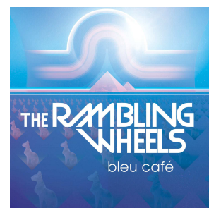
Le single Bleu Café

Si l'on on peut reconnaître chez eux des influences telles que The Strokes, The Feelings voire Muse, le 1er single « Bleu Café » démontre un vrai talent et un style bien à eux ! Sur l'hymne pop « We Are All Here », on retrouve des reminiscences de The Kooks, Crowded House ou Modest Mouse. Résolument rock en dépit de ces incursions discoïdes, avec « Ready Or Not », The Rambling Wheels marchent dans les traces de Kaiser Chiefs et de The Klaxons. Au gré de cet album chatoyant au nom improbable, surgissent tour à tour des étincelles de MGMT, des flamboyances dignes de The Killers et des embrasements Pink Floydien... Allez, foncez !